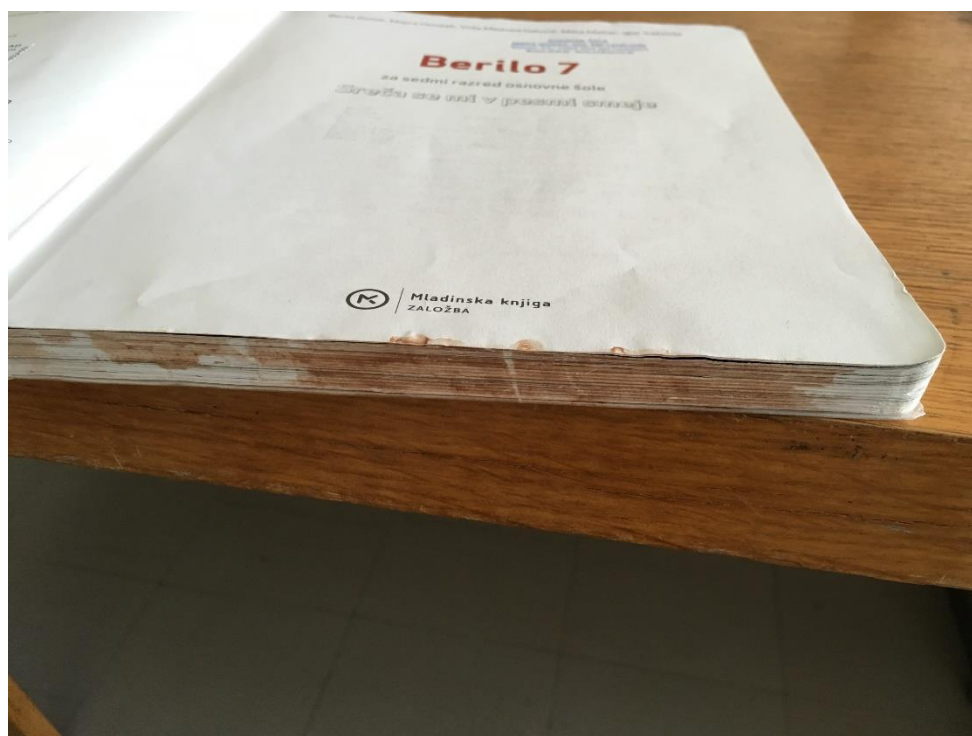
Zmečkana hruška je umazala učbenik.