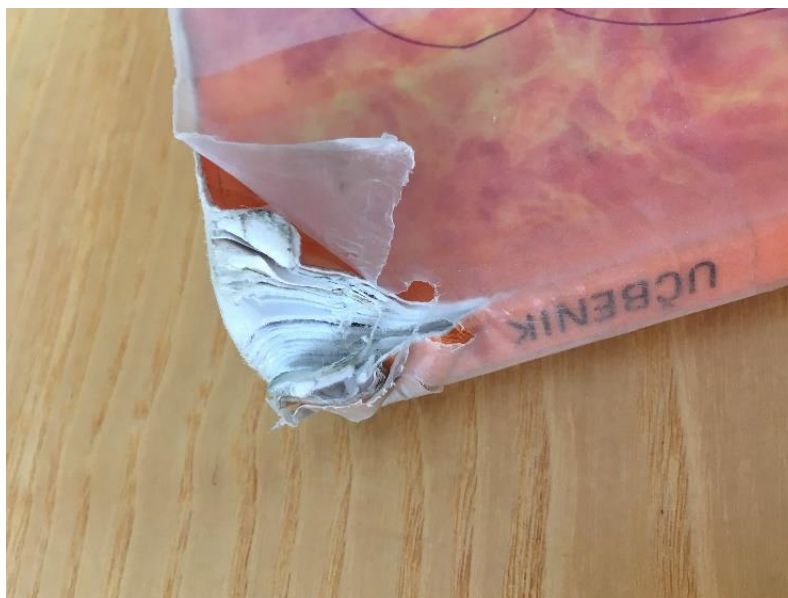
Močno poškodovan učbenik le po enem letu uporabe