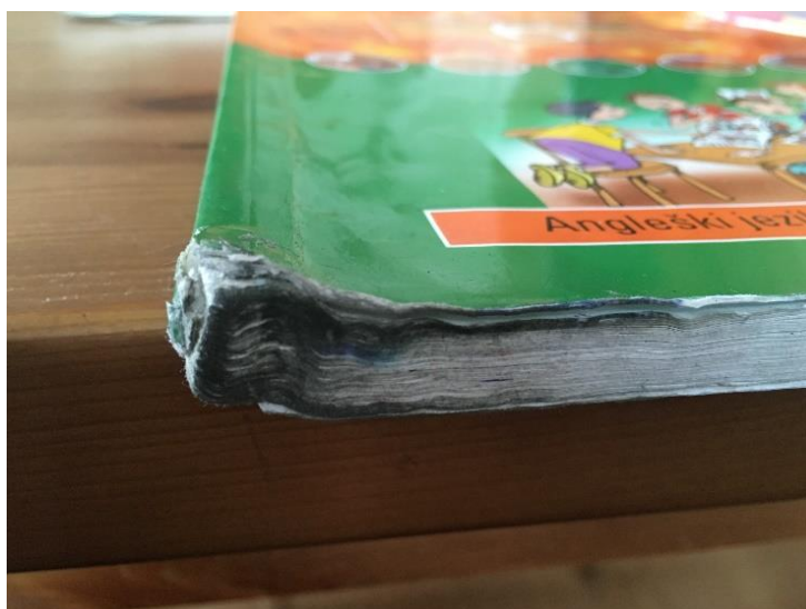
Primer močno umazanega učbenika