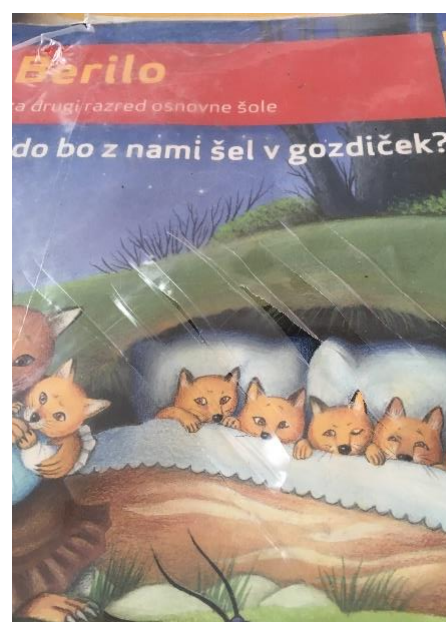
Primeri poškodovanih ovitkov.